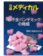
日経メディカル (医師)