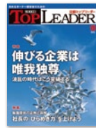
日経トップリーダー (中堅・中小企業経営者)