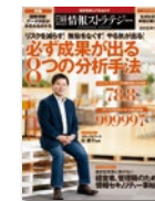
日経情報ストラテジー (情報化推進ビジネスリーダー)