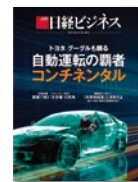
日経ビジネス (ビジネスリーダー)