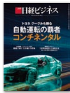
日経ビジネス (ビジネスリーダー)

新築高級マンションの販売促進を目的に 首都圏の高額所得者をターゲットとしてカタログを送付