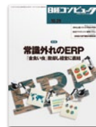
日経コンピュータ (ユーザー企業のITキーパーソン)

自社のIT製品やソリューションを紹介するプライベートセミナーを 東京、大阪、名古屋で開催するにあたり、企業のITキーパーソンに参加案内を送付